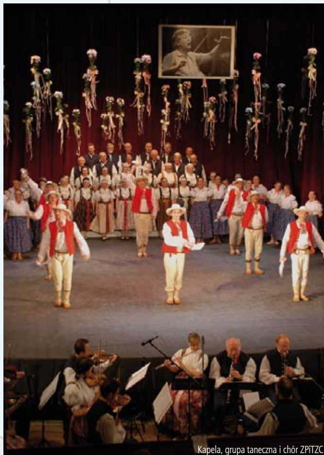
Kapela, grupa taneczna i chór ZPITZC