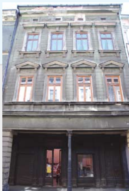
Kamienica przy ul. Głębokiej 11