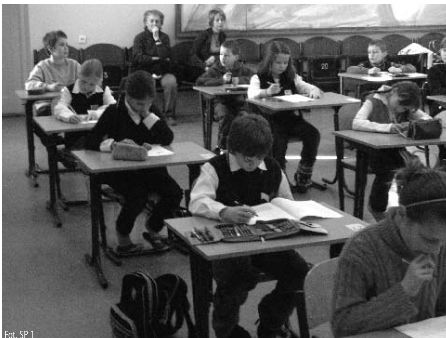
Fot. SP 1