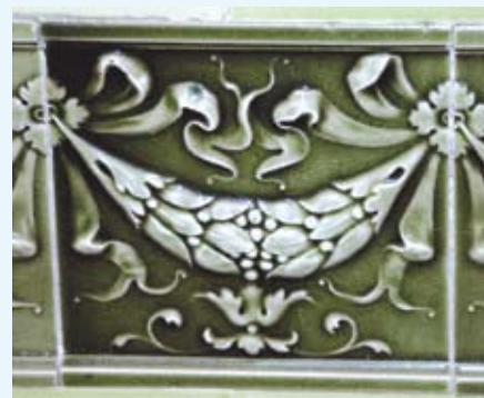
Zabytkowe, ceramiczne kafle znajdujące się w sklepie mięsnym